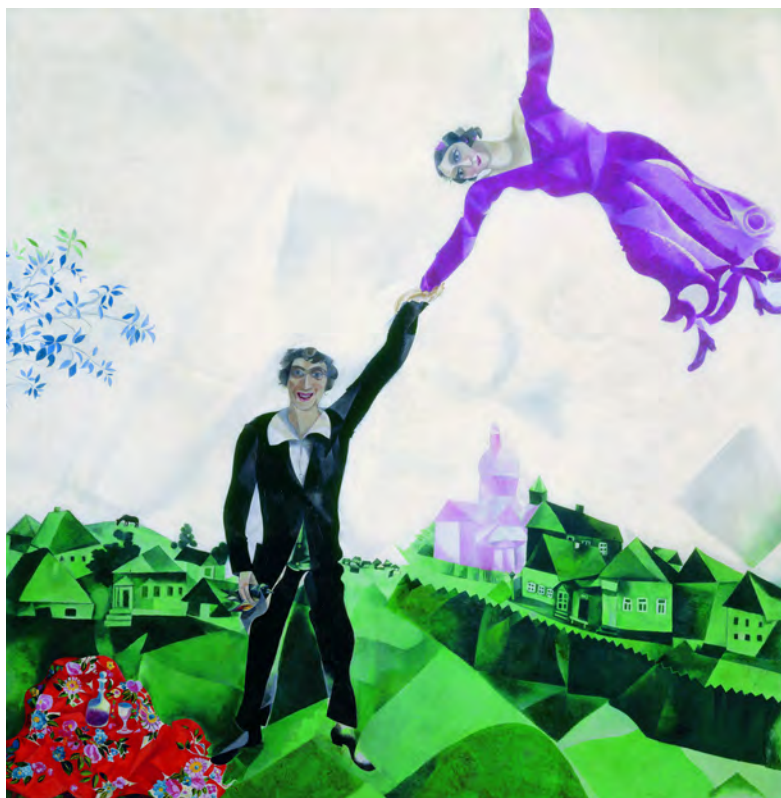
Marc Chagalls "Promenaden" föreställer honom själv och hans fru Bella.

Jiddischkulturens guldålder började under 1900-talets första år, hade sin kulmen under mellankrigstiden och krossades totalt av Förintelsen. Under dessa år utvecklades litteraturen på jiddisch och blev inom alla områden jämställd med